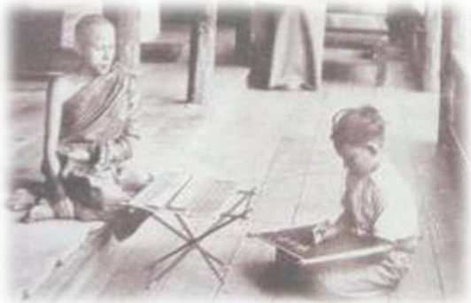
ไทรสอนไทรสอบ