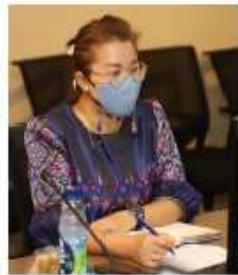
หัวหน้าหน่วยตรวจสอบภายใน

“ชี้แจงแนวปฏิบัติและขั้นตอนการให้บริการสถานที่แก่หน่วยงานภายนอก” เมื่อวันพุธที่ 17 มีนาคม 2564 ใช้เวลา 1 ชั่วโมง (10.00 – 11.00 น.) ณ ห้องประชุมสารนิทัศน์ อาคารบริหาร