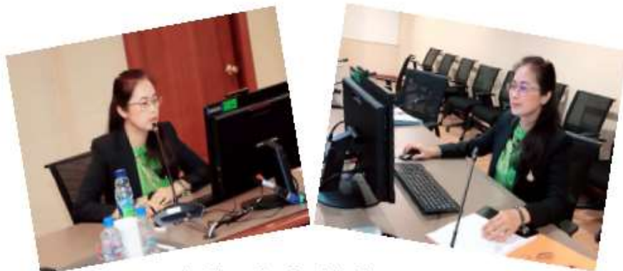
หัวหน้าส่วนบริหารสินทรัพย์ : ผู้บรรยาย Show&Share

ผู้แทนประธานคณะทำงานประธานคณะทำงานโครงการประเมินคุณธรรมและความโปร่งใสในการดำเนินงานของมหาวิทยาลัยเทคโนโลยีสุรนารี