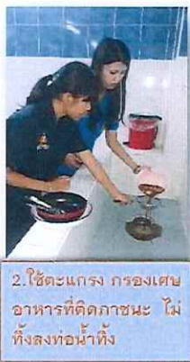
2. ใช้ตะแกรง กรองเศษ อาหารที่ติดภาชนะ ไม่ ทิ้งลงท่อน้ำทิ้ง

ชาวหอพักร่วมมือ ป้องกันเศษอาหารอุดตันในท่อน้ำทิ้งหอพัก