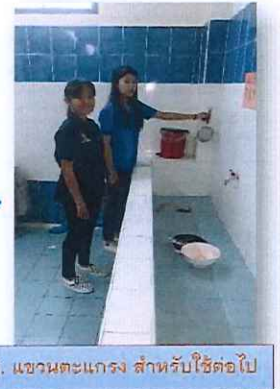
5. แขนงตะแกรง สำหรับใช้ต่อไป