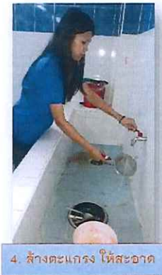
4. ล้างตะแกรง ให้สะอาด