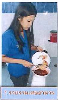
1. รวบรวมเศษอาหาร