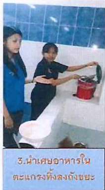
3. นำเศษอาหารใน ตะแกรงทิ้งลงถังขยะ