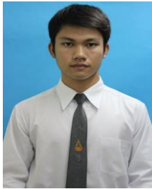
การแต่งกายนักศึกษาชาย

นักศึกษาชาย แต่งกายชุดพิธีการ โดยสวมเสื้อเชิ้ตสีขาวแขนยาว ไม่มีลวดลาย ปกเสื้อปลายแหลม ผ่าอกตรง โดยตลอด ติดกระดุมสีขาว มีกระเป๋าด้านซ้าย ผูกเนคไทของมหาวิทยาลัยพื้นสีเทา ปักตรามหาวิทยาลัย ( ไม่ต้องติดเข็ม เข็มรูนุ่ หรือเครื่องหมายอื่นใดบนเนคไทอีก ) ไว้ผมทรงสุภาพไม่ปรกหน้า ไม่ควรแต่งสีผม ไม่ควรไว้หนวดหรือเครา และไม่สวมเครื่องประดับใดๆ ทั้งสิ้น ดังภาพตัวอย่าง