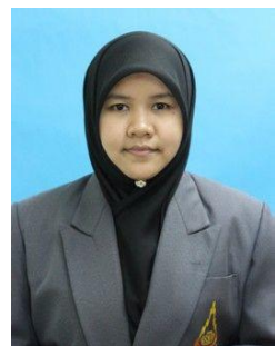
แบบ 3 นักศึกษาหญิงมุสลิม