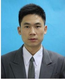
แบบ 1 แต่งกายตามระเบียบมหาวิทยาลัยฯ

นักศึกษาชาย แต่งกายชุดสุภาพ โดยสวมเสื้อเชิ้ตสีขาวหรือสีอ่อน ไม่มีลวดลาย ผูกเนคไทสีพื้น และสวมสูททับ ไว้ผมทรงสุภาพไม่ปรกหน้า ไม่ควรแต่งสีผม ไม่ควรไว้หนวดหรือเครา และไม่สวมเครื่องประดับใดๆ ทั้งสิ้น หรือแต่งเครื่องแบบข้าราชการ ดังภาพตัวอย่าง