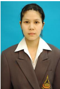
แบบ 1 รวบผมให้เรียบร้อย

นักศึกษาหญิง แต่งกายชุดสุภาพ โดยสวมเสื้อเชิ้ตสีขาวหรือสีอ่อน ไม่มีลวดลาย และสวมสูททับ ไว้ผมทรงสุภาพไม่ปรกหน้า ไม่ควรแต่งสีผม หากผมยาวให้มัดผมหรือรวบผม หรือให้ผมอยู่ด้านหลัง และไม่สวมเครื่องประดับใดๆ ทั้งสิ้น หรือแต่งเครื่องแบบข้าราชการ ดังภาพตัวอย่าง