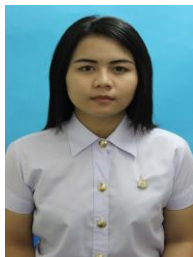
แบบ 2 ปลอยผมไปด้านหลัง