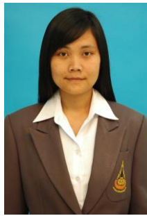
แบบ 2 ปล่อยผมไปด้านหลัง