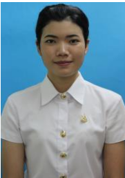
แบบ 1 รวบผมให้เรียบร้อย

นักศึกษาหญิง แต่งกายชุดพิธีการ โดยสวมเสื้อเชิ้ตสีขาวแขนสั้น ไม่มีลวดลาย ปกเสื้อปลายแหลม ( ไม่ต้องติดตุ้มตั้ง หรือเครื่องหมายอื่นใดที่ปกเสื้ออีก และไม่ควรสวมเสื้อแฟชั่น หรือเสื้อตามสมัยนิยม เพื่อใช้ในการถ่ายรูป เพราะผิดระเบียบการแต่งกาย และมีลักษณะที่ไม่ถูกต้อง ) ผ่าอกตรงโดยตลอด ติดกระดุมโลหะชุบทองสัญลักษณ์ของมหาวิทยาลัย ติดเข็มกลัดเสื้อชุบทองเครื่องหมายของมหาวิทยาลัย กัดเห็นเอวระดับอกด้านซ้าย เนื้อผ้าหนาพอสมควร ไว้ผมทรงสุภาพไม่ปรกหน้า ไม่ควรแต่งสีผม หากผมยาว ให้มัดผมหรือรวบผม หรือให้ผมอยู่ด้านหลัง และไม่สวมเครื่องประดับใดๆ ทั้งสิ้น ดังภาพตัวอย่าง