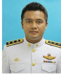
แบบ 2 แต่งกายชุดข้าราชการ

นักศึกษาหญิง แต่งกายชุดสุภาพ โดยสวมเสื้อเชิ้ตสีขาวหรือสีอ่อน ไม่มีลวดลาย และสวมสูททับ ไว้ผมทรงสุภาพไม่ปรกหน้า ไม่ควรแต่งสีผม หากผมยาวให้มัดผมหรือรวบผม หรือให้ผมอยู่ด้านหลัง และไม่สวมเครื่องประดับใดๆ ทั้งสิ้น หรือแต่งเครื่องแบบข้าราชการ ดังภาพตัวอย่าง